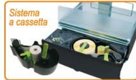
Sistema a cassetta

Sistema a cassetta nella stampante di etichette della Serie MISTRAL .