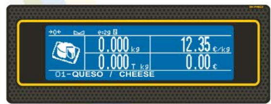
Display grafico "L"