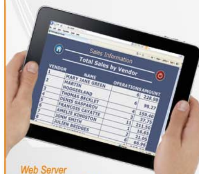
Web Server disponibile in italiano.

Software Windows: Configurazione della bilancia - Informazioni di vendita e gestione Progettazione di scontrini ed etichette Nuova applicazione DFS: potente, ma molto semplice