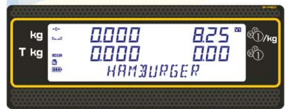
Display LCD a segmenti "Superlux"