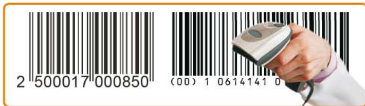
* Lettura dei codici GS1 DataBar disponibile prossimamente.

Inoltre, alcuni modelli permettono la connessione ad uno scanner, alimentato elettricamente dalla stessa bilancia , per la lettura dei codici a barre.